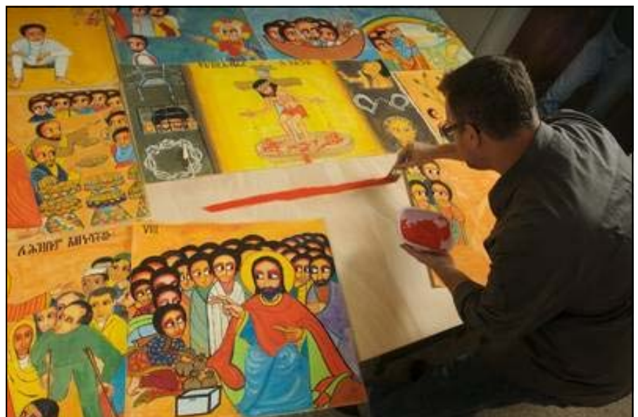
Hungertücher-Ausstellung