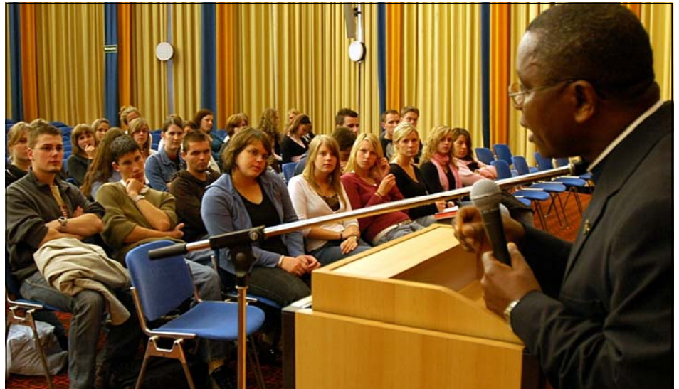
Bishop Shao Gymnasium am Turmhof Mechernich

Ein erstes Produkt dieser Aachener "Entwicklungshilfe" war die Reise der Gruppe. Es wurde eine erlebnisreiche Tour mit dem Ziel, das Land und die Menschen kennen zu lernen und natürlich Bischof Shao zu treffen. Auf Sansibar gehörte z.B. zum Programm der Besuch im Machui Community College, einer kirchlichen Ausbildungsstätte für Christen und Muslime in verschiedenen handwerklichen Berufen, Expertengespräche zum Thema Aids, das alltägliche Leben einer christlichen Minderheit in einer islamischen Gesellschaft, die Führung durch eine Gewürznelkenfarm .... Die Reisegruppe hat in einem ausführlichen Reisebericht ihre Erfahrungen in Tansania und Sansibar in Wort und Bild Tag für Tag