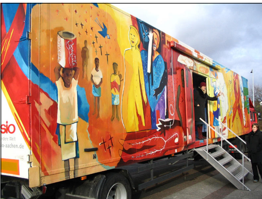
Aids-Truck; Foto: missio

Im Frühjahr haben wieder die weiterführenden Schulen, Verbände und Gemeinden im Bistum Aachen die Möglichkeit, den Aids-Truck von missio zu besichtigen. Der Aids-Truck ist eine mobile, multimediale Ausstellung und vermittelt eindrucksvoll und anschaulich das Thema HIV und AIDS in Afrika.